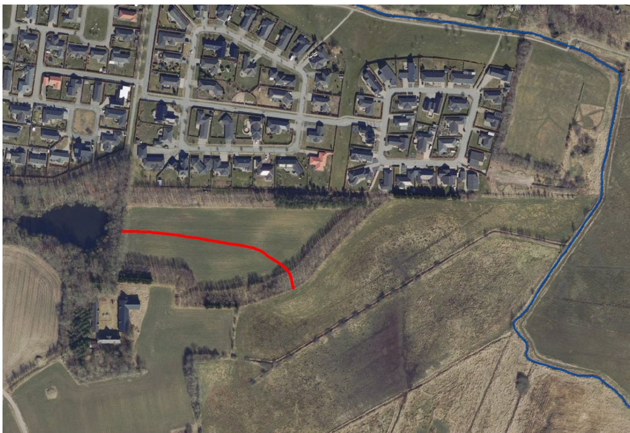
Det rørlagte vandløb, der ønskes frilagt, er markeret med en rød streg

Projektet offentliggøres på Kolding Kommunes hjemmeside og sendes direkte til berørte parter samt til høringsberettigede organisationer.